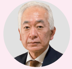
法人本部事務局長