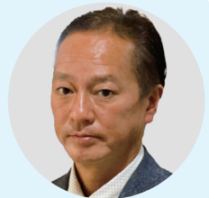
太陽の家二番館施設長

二〇一五年一〇月に開設し来年が十年の節目となる今年は、ご入居者・ご家族・職員にとって『より良きものに変える』ことを躊躇せず挑戦していく姿勢を常に持ち続け、小さまざまなことを変えてきた昨年の取組みをブラッシュアップして『土台固めの年』とします。また同時に『ご縁を大切に』地域貢献活動を拡大していきたいと思っております。無症状発症もある感染症罹患リスクは、施設にとって以前より増していますが、発症後の初動を強化して拡大させないよう努めて、笑顔と笑いの多い一年にしていきたいです。