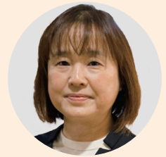
横須賀エリア統括管理者