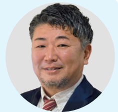
横浜・県央エリア統括管理者

日常を取り戻すべくご家族との面会や、施設行事を行っておりますが、まだまだ緊張が続きます。ご入居者ご利用者の生活とご家族の安心を支えられるよう、よりよいサービスを提供してまいります。