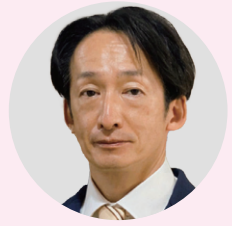
横須賀エリア次長