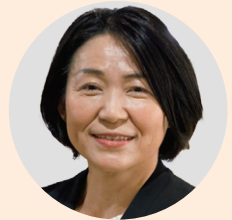
横浜・県央エリア次長